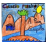
CEIP PUIG CAMPILLO